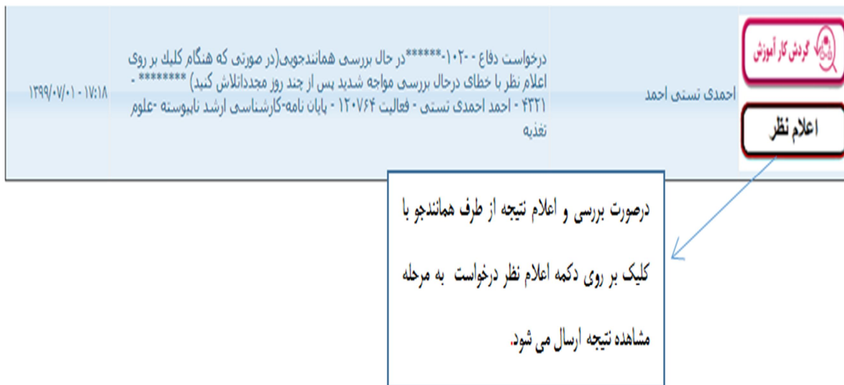
شکل ۴- منتظر اعلام نتیجه همانندجویی

در مرحله بعد باید منتظر اعلام نظر از سامانه همانندجو بمانید.